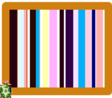
Obr. 4: Vankúš pre 20 pásikov

Myšiak Mickey sa rozhodol navrhnuť vzory na svoje vankúše. Majú to byť pružky rôznej hrúbky a farby. Podmienka je ale počet prúžkov na vankúši. Pomôžte myšiakovi vytvoriť program, ktorý vykreslí vankúš s načítaným počtom prúžkov na vankúšiku. Výška vankúša nech je 100 bodov. Pozrite sa na ukážky vankúšikov: