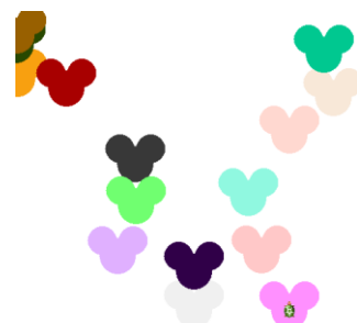
Obr. 1: Ukážka opečiatkovanej steny

Vstupné parametre sú: veľkosť pečiatky a počet pečiatok na stene. Všetky pečiatky sú rovnako veľké. Farby pečiatok sú náhodné.