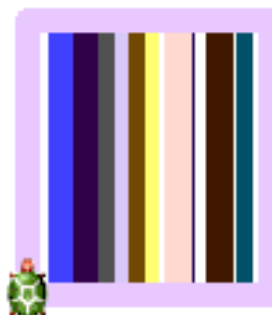
Obr. 3: vankúš pre 15 pásikov